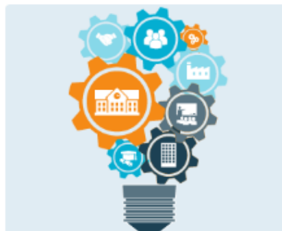
5. Stakeholders involvement