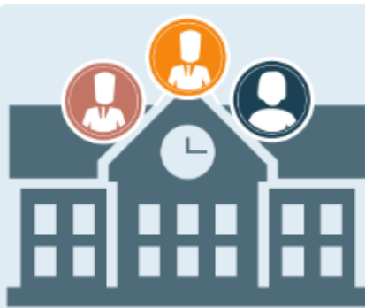
1. School governance