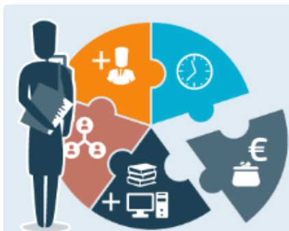
3. Support to learners