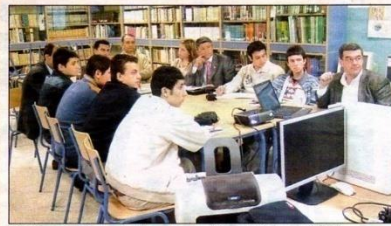
Visita. Alumnos y profesores se han interesado por los estudios en el IES Hermanos Machado.

Los hermanos machado > proyectos europeos