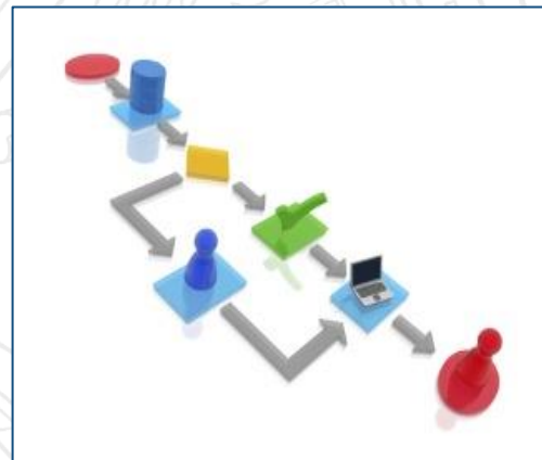
Gestión de Procesos de Evaluación