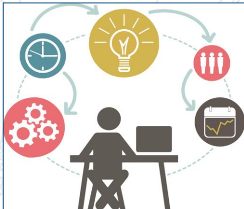
Gestión Panel Evaluadores