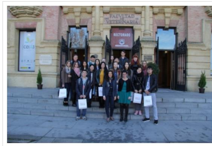
Foto de familia de autoridades y alumnos