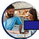
Oportunidades de cooperación (Acción Clave 2-KA2)