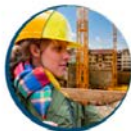
Oportunidades de movilidad (Acción Clave 1-KA1)

¿Qué oportunidades ofrece Erasmus+ en este sector?