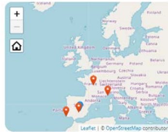
Display the project's participants on map